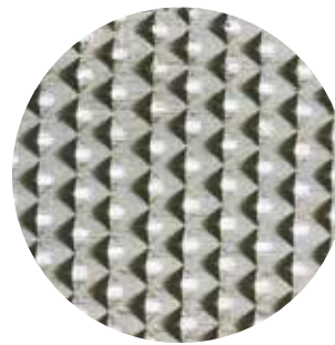
鬼目 (両面) Rasps Cut (Both sides)